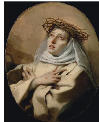
Giovanni Battista Tiepolo, Hl. Katharina von Siena, 1746

Die Heilige Katharina von Siena (1347–1380) ist Kirchenlehrerin, Patronin Italiens und Europas. Zeit ihres Lebens hatte die Ordensfrau mystische Visionen der innigen Verbundenheit mit Christus. Sie engagierte sich in der Armen- und Krankenpflege, forderte eine Reform der Kirche und setzte sich für deren Einheit ein. Wir feiern ihren Gedenktag am 29. April.